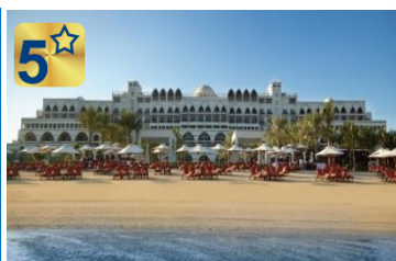
جمیرا زعبیل سرای

لوکس ترین هتل ۵ ستاره مجلل به سبک قصر عثمانی ترانسفر لوکس اختصاصی AUDI A6 رایگان شاتل سرویس رایگان به مرکز خرید و پارک آبی استفاده رایگان نامحدود از پارک آبی وایلد وادی