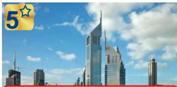
جمیرا امارات تاورز

نزدیک ترین هتل ۵ ستاره به ساختمان مرکز تجارت جهانی ترانسفر لوکس اختصاصی AUDI A6 رایگان استفاده رایگان نامحدود از پارک آبی وایلد وادی شاتل سرویس رایگان به ساحل جمیرا و مرکز خرید و پارک آبی