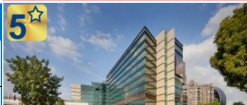
جمیرا کریک ساید

بزرگ ترین هتل ۵ ستاره دیره ترانسفر ون مختص هتل رایگان استفاده رایگان نامحدود از پارک آبی وایلد وادی شاتل سرویس رایگان به پارک آبی